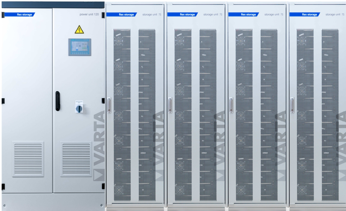
Abbildung 1: E 120/300 – beispielhafte Darstellung (Abbildung ähnlich)